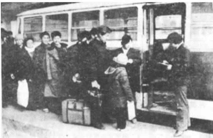
客运高峰井然有序