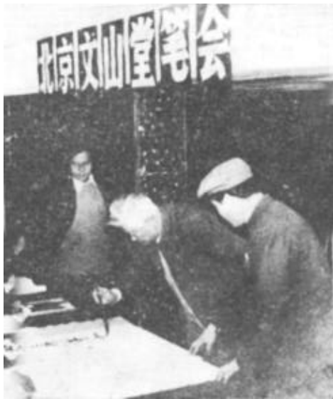
东营师范美术展览现场

这次展览，是东营师范美术教学工作的一次检阅。东营师范历来十分重视学生的美术基本功训练，在美术教学中取得了比较好的成