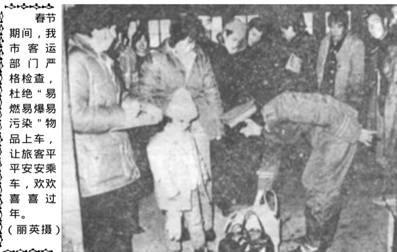
春节期间,我市客运部门严格检查,杜绝“易燃易爆易污染”物品上车,让旅客平平安安乘车,欢欢喜喜过年。